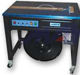
Masa Tipi Çember Makinasi Semi Automatic Strapping Machine