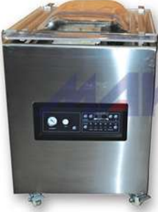
Vakum Makinasi Vacuum Packaging Machine

Produse: Mașini de ambalat, sisteme industriale de ambalare și transport, benzi de securitate și siguranță